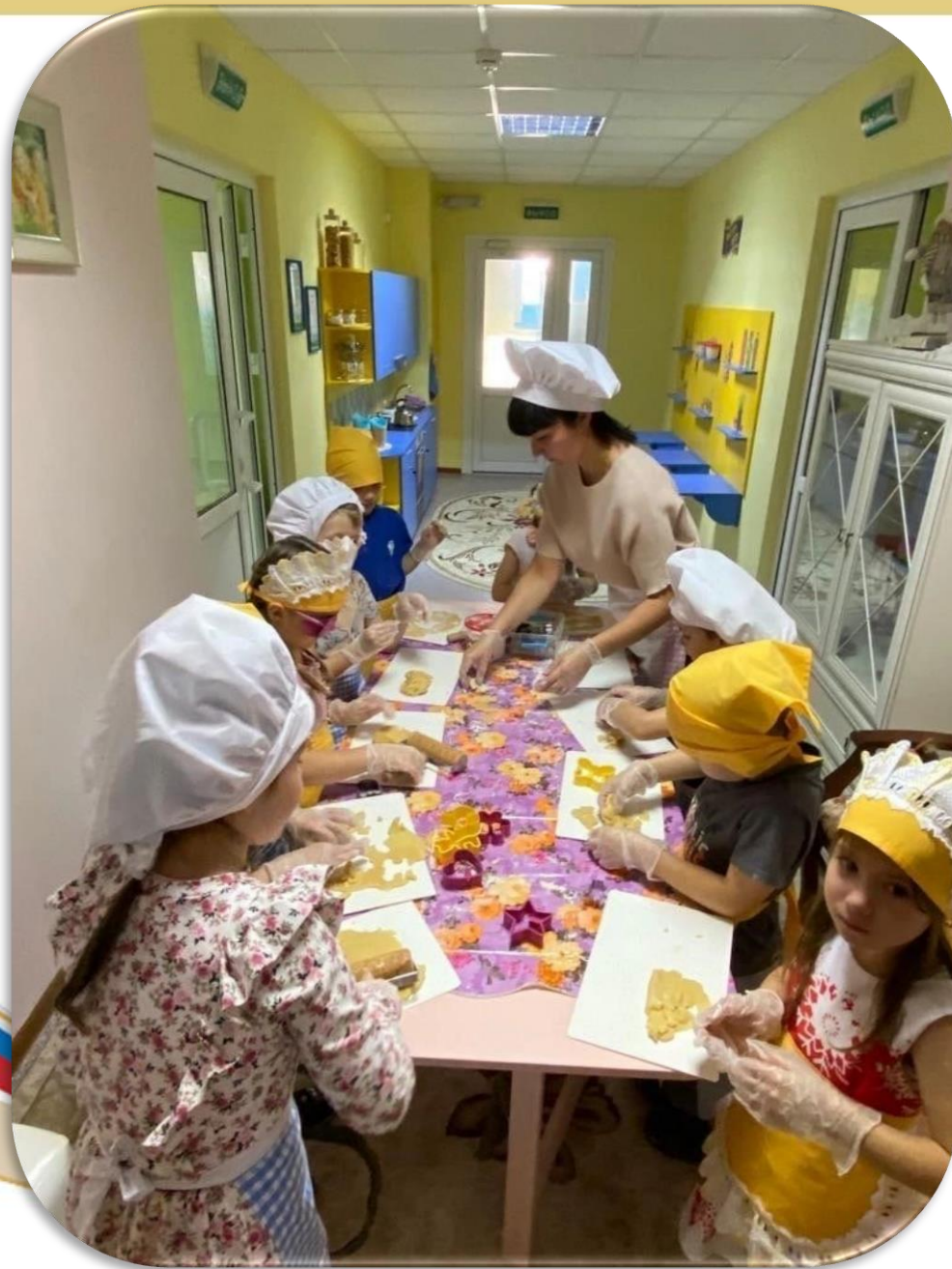
Воспитанники готовят печенье для мам